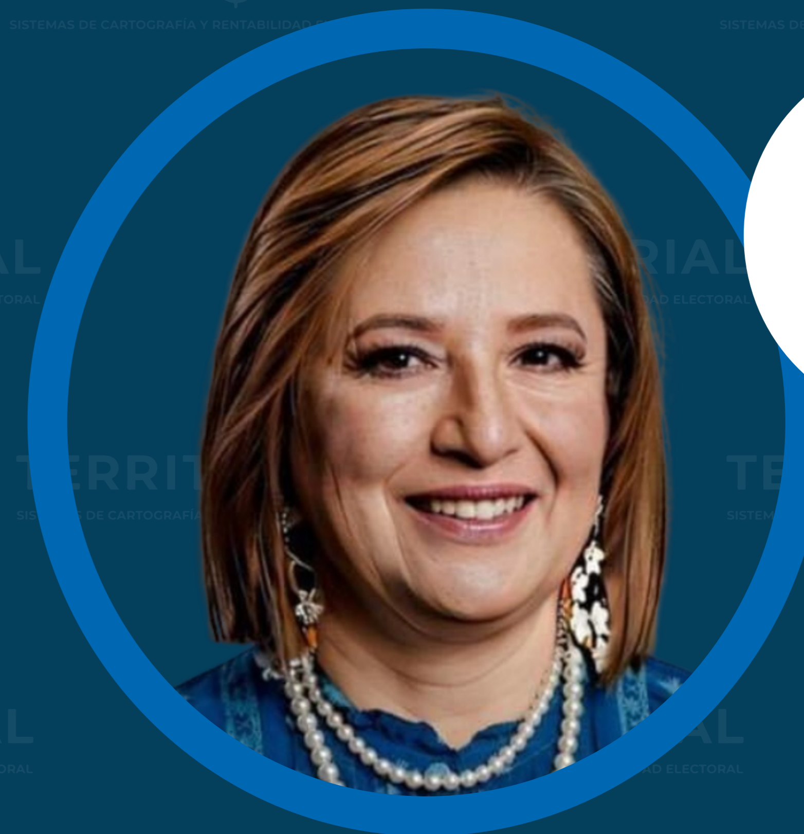
XÓCHITL GÁLVEZ (PAN)