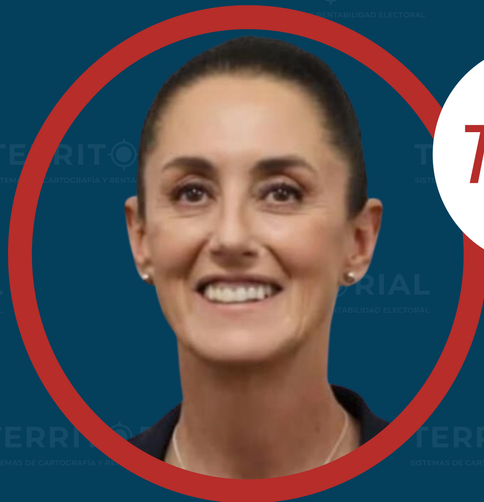
CLAUDIA SHEINBAUM (MORENA)

¿A QUIÉN DE LAS Y LOS PRECANDIDATOS A LA PRESIDENCIA DE LA REPÚBLICA CONOCE?